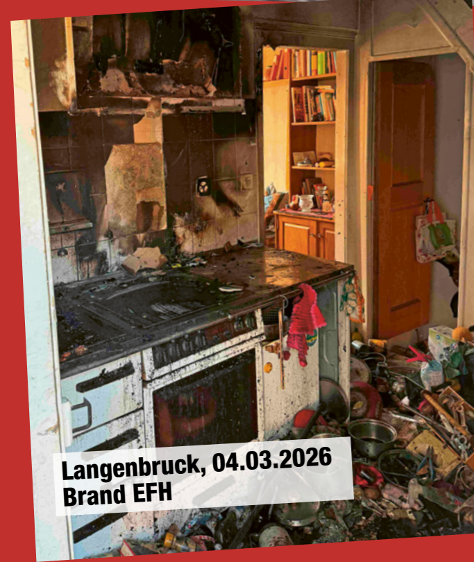
Langenbruck, 04.03.2026 Brand EFH