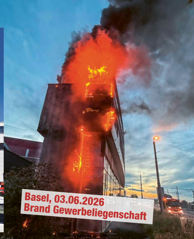
Basel, 03.06.2026 Brand Gewerbeliegenschaft