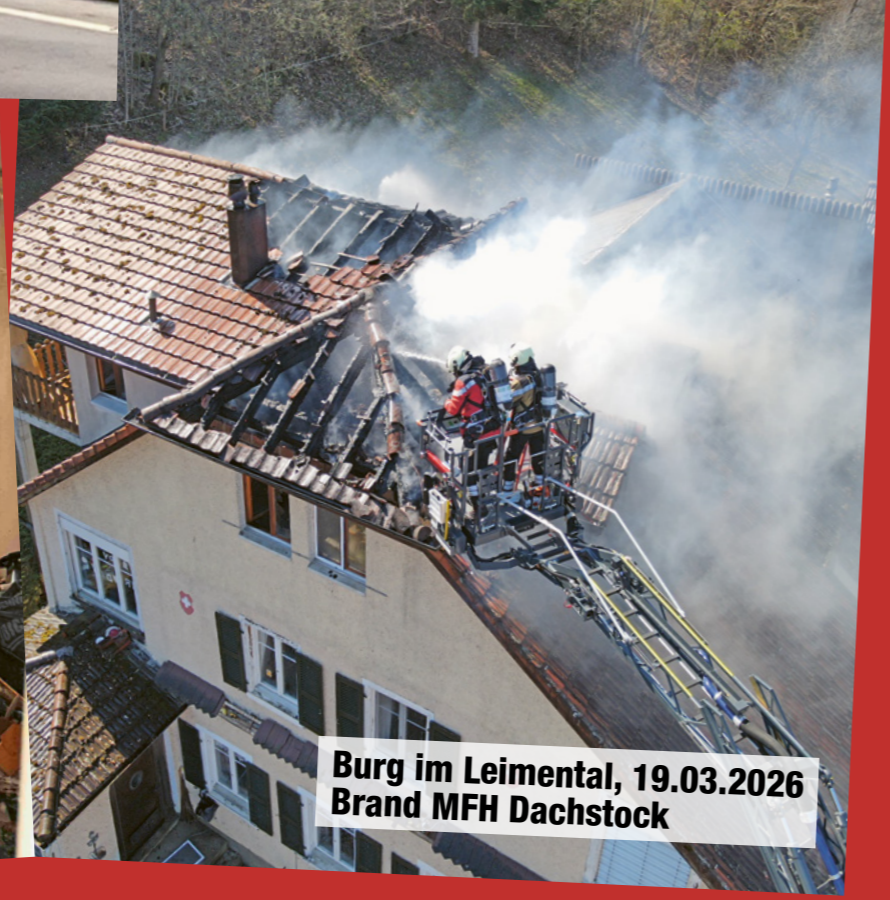
Burg im Leimental, 19.03.2026 Brand MFH Dachstock