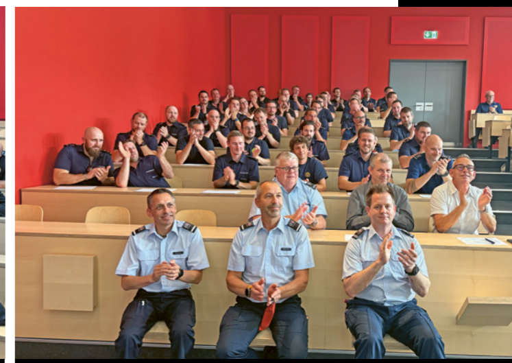
Diplomfeier und Übergabe der Fähigkeitsausweise