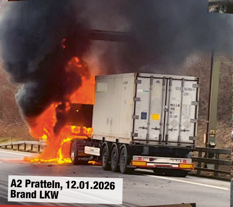
A2 Pratteln, 12.01.2026 Brand LKW