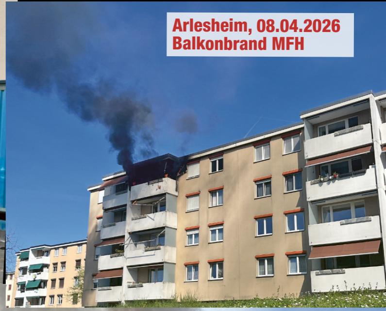
Arlesheim, 08.04.2026 Balkonbrand MFH