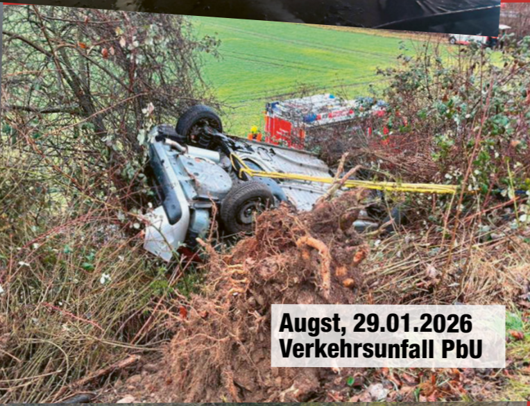
Augst, 29.01.2026 Verkehrsunfall PbU