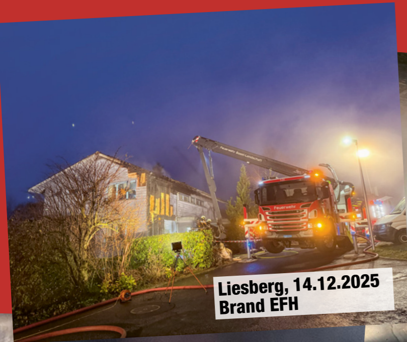
Liesberg, 14.12.2025 Brand EFH