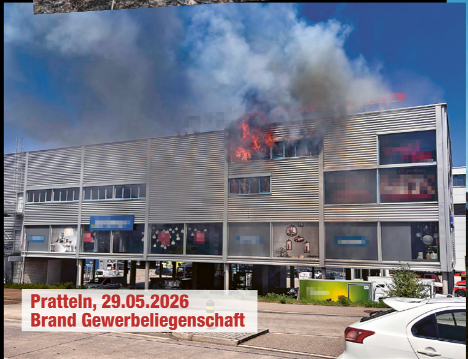
Pratteln, 29.05.2026 Brand Gewerbeliegenschaft