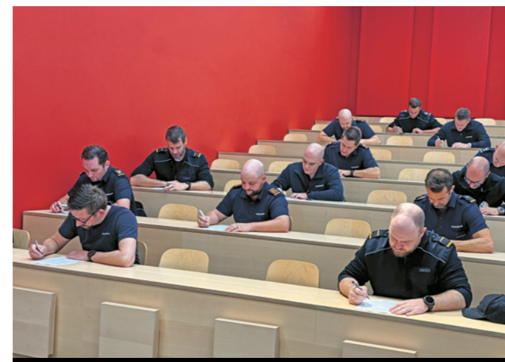
Erfolgskontrolle am Abschluss des Kurses

Konfliktmanagement: • Klare Kommunikation als Schlüssel zur Konfliktlösung. • Auch in schwierigen Situationen respektvoll im Dialog.