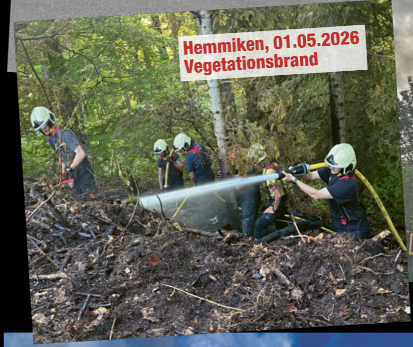
Hemmiken, 01.05.2026 Vegetationsbrand