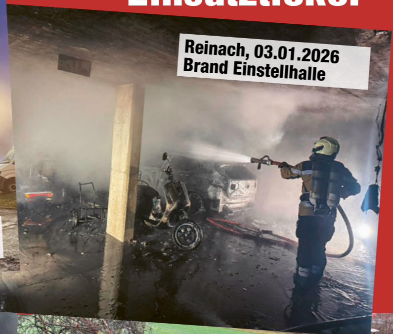
Reinach, 03.01.2026 Brand Einstellhalle