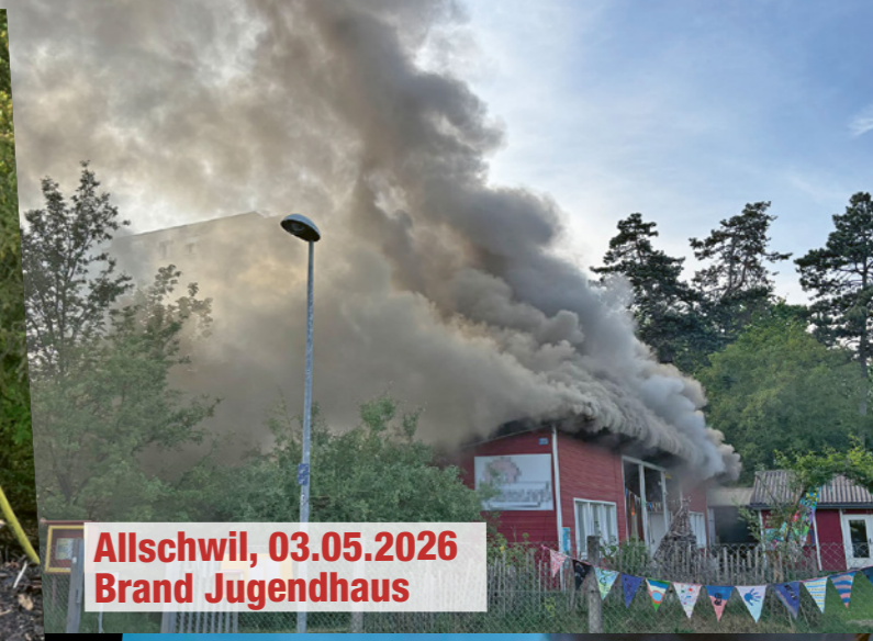
Allschwil, 03.05.2026 Brand Jugendhaus