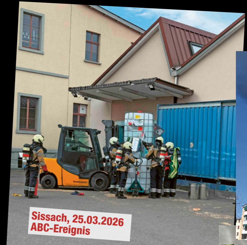
Sissach, 25.03.2026 ABC-Ereignis